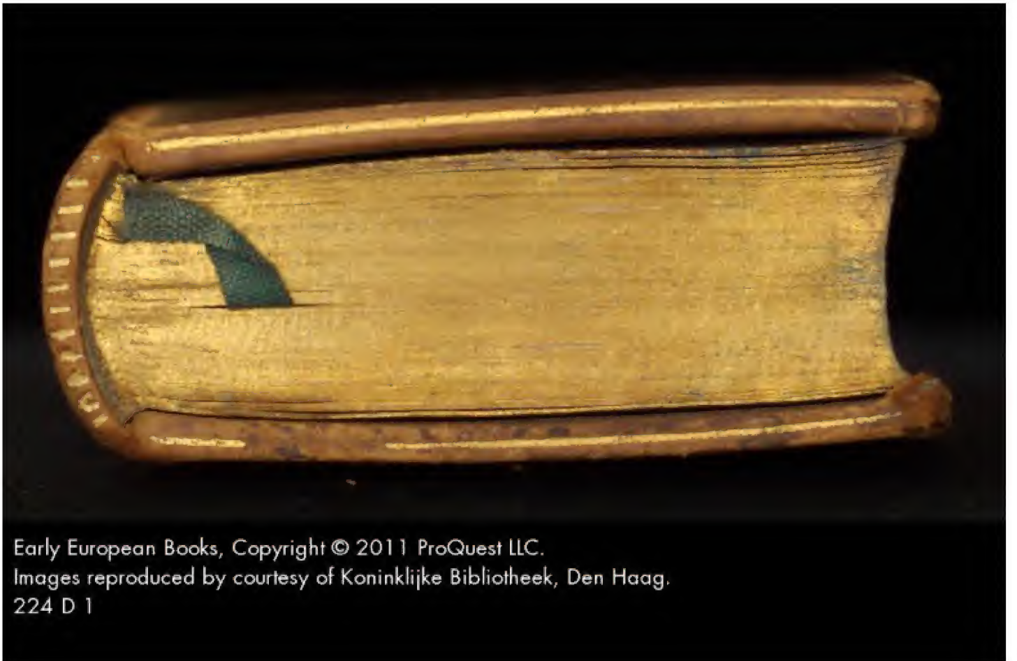
224 D 1